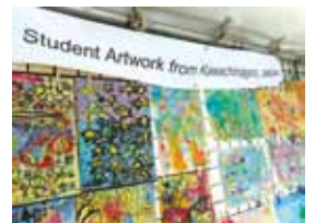
昨年のアートフェスティバルで

絵画教室日程：8月2日(火) 時 間：13:00~17:00 場 所：市民交流センター 4階 創作工房 参加費：300円 持ち物：水彩画用具、水筒 定 員：先着25名 (対象：小・中学生)