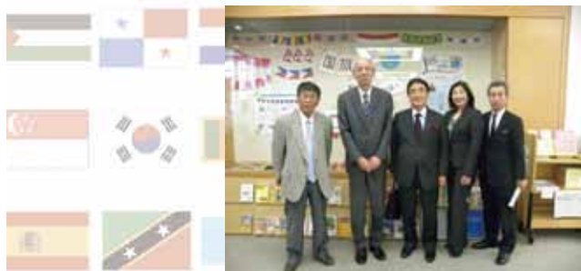
図書館の講演会の掲示の前で

NPO 法人ユーラシア 21 研究所理事長 認定 NPO 法人難民を助ける会特別顧問 国旗にまつわる書籍等多数執筆