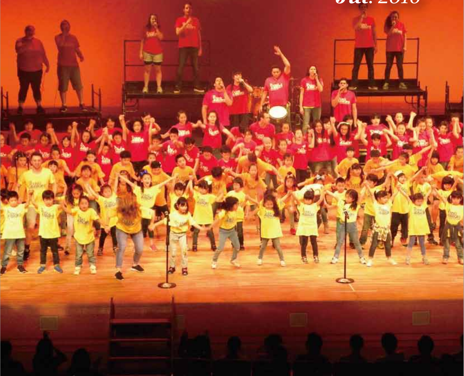
ヤングアメリカンズ 河内長野公演の様子